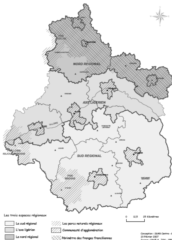
Fig. 1 — Les trois sous-ensemble de l'action publique territoriale en région Centre

Au sein de la région Centre, l'aire ligérienne comprend les agglomérations d'Orléans, de Blois et de Tours, ainsi qu'un ensemble de villes petites et moyennes situés aux alentours. Cet espace constitue un des trois sous-ensembles traditionnellement envisagés dans les réflexions sur l'aménagement régional avec le nord régional (dénommé « franges franciliennes ») et le sud régional 3 (cf. figure 1 infra ).