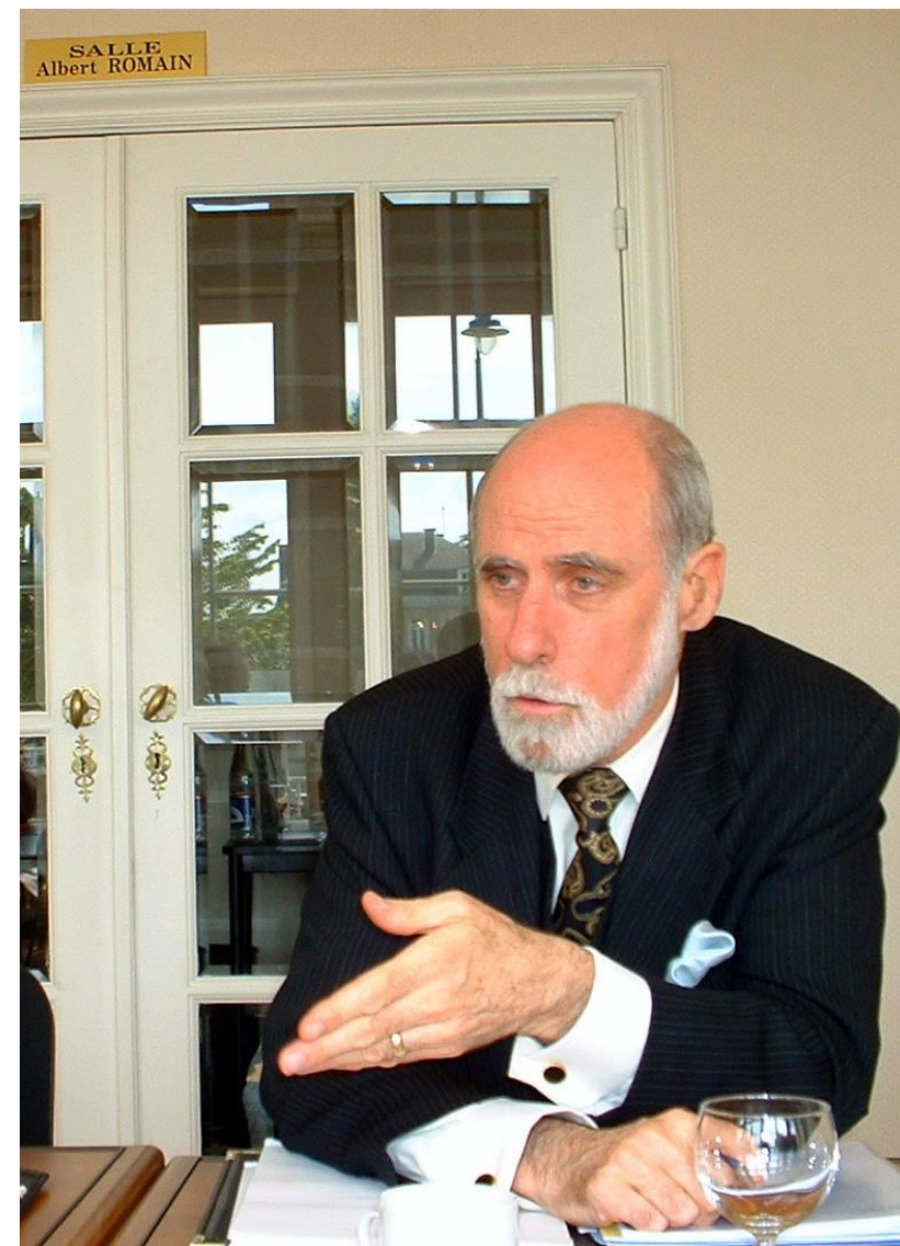
Vint Cerf reçu par le Chapitre Wallonie à l'Institut Destrée